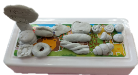
↑「粘土で作ったパン屋さん」